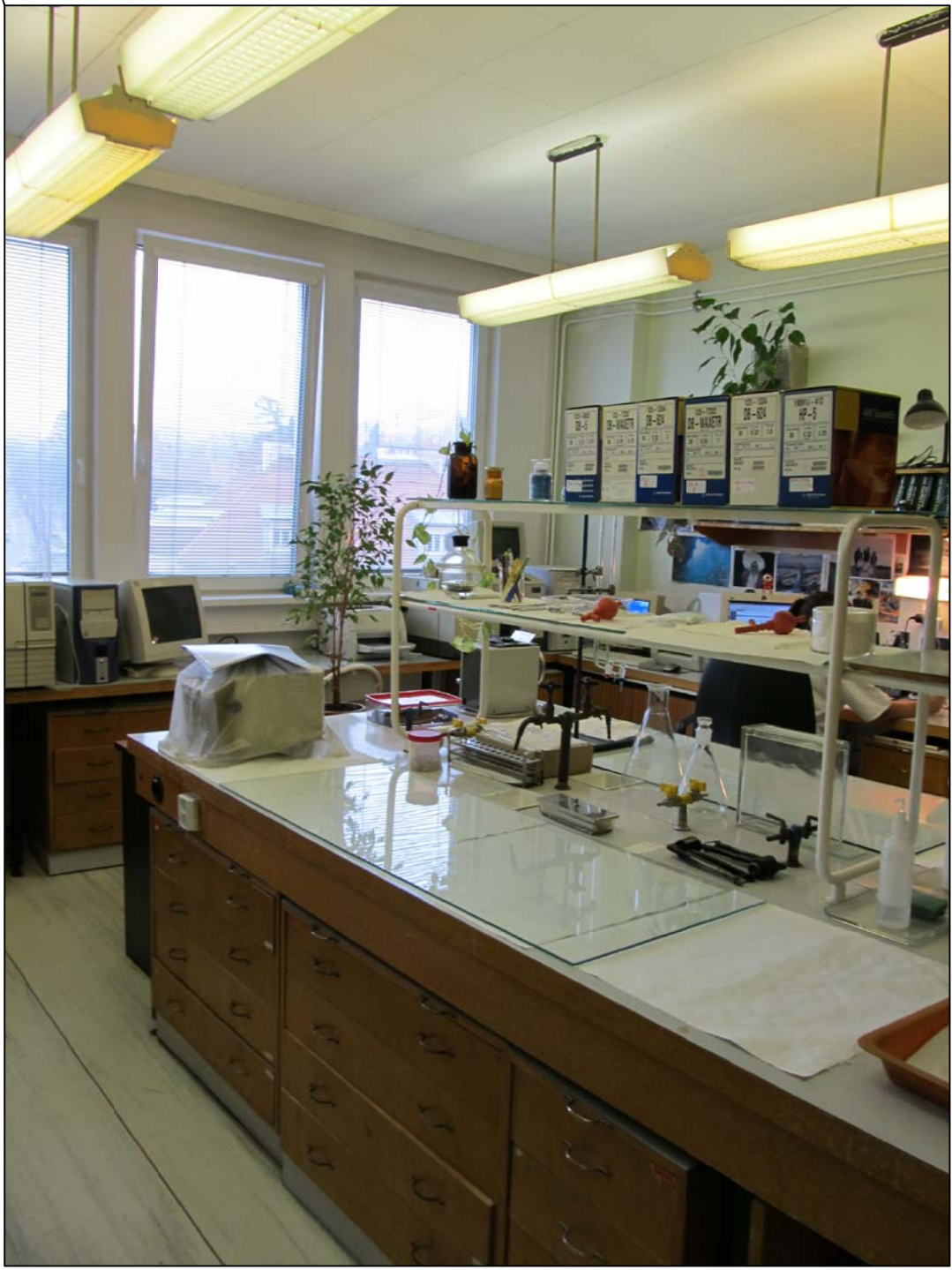
STÁVAJÍCÍ ZAŘÍZENÍ LABORATOŘE – BUDE ODBRÁNĚNO