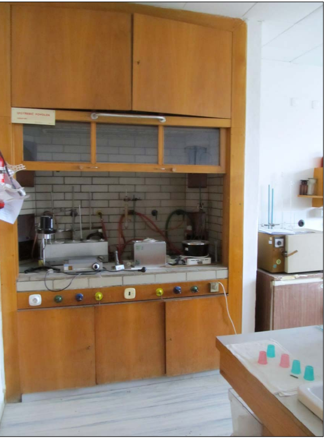
STÁVAJÍCÍ DIGESTOR – BUDE ODBRÁNĚNA