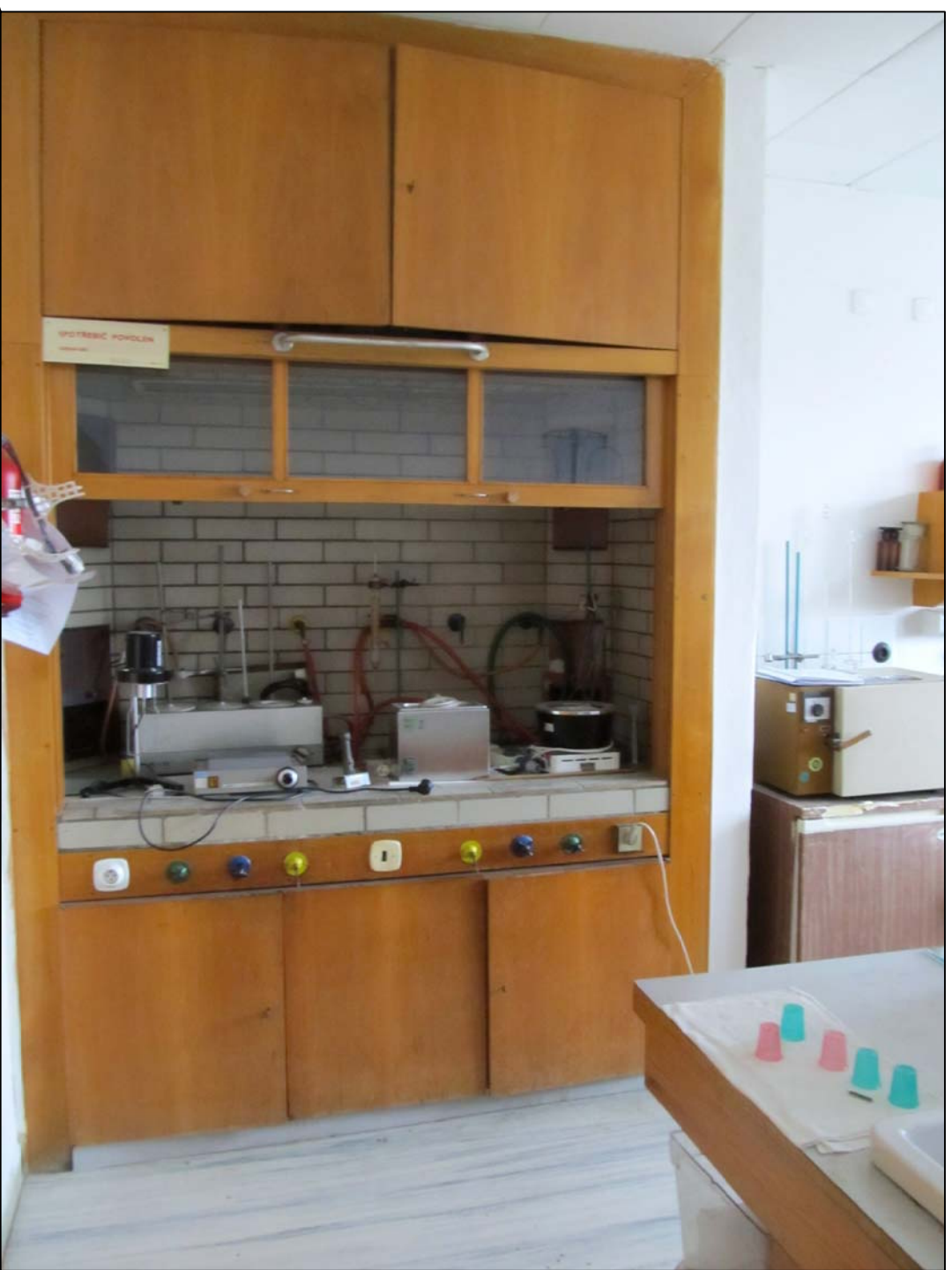
STÁVAJÍCÍ DIGESTOŘ - BUDE ODSTRANĚNA