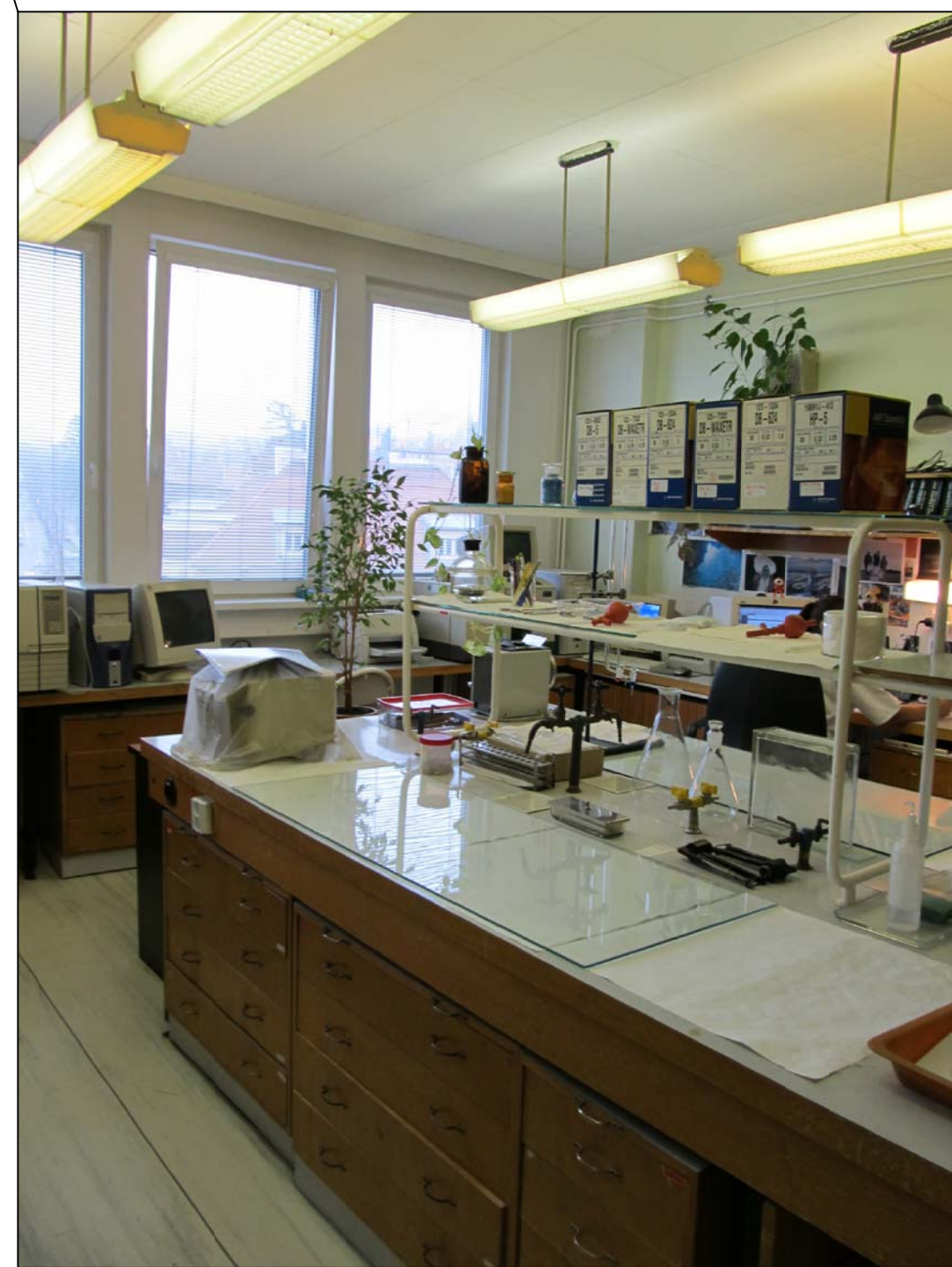
STÁVAJÍCÍ ZAŘÍZENÍ LABORATORĚ - BUDE ODSTRANĚNO