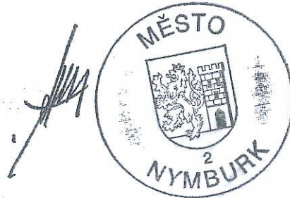
Ladislav Kutík starosta města Nymburk